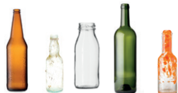
Bouteilles en verre