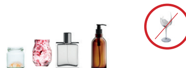
Pots, bocaux et flacons en verre