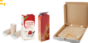
Emballages en carton